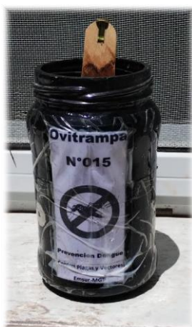
Figura 3. Muestra de ovitrampa utilizada en el muestreo.

Las ovitrampas consisten en un frasco de vidrio pintado de color negro que contiene agua limpia en su interior y un trozo de madera, tipo bajalengua, con borde rugoso fijado con un clip grande para sujetar el mismo (Figura 3). El diseño está basado en la necesidad biológica de las hembras grávidas de los mosquitos de procurar un espacio húmedo para la oviposición, y buscando una superficie rugosa, como la madera, para la adherencia de los huevos (Figura 3). Cada ovitrampa se encuentra debidamente rotulada numéricamente.